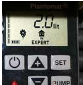
Plantomat® - eingebaut im Gefäß