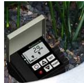
Plantomat® im Einsatz

Ein positiver Effekt neben einer optimalen Pflanzenversorgung ist die Kosteneinsparung durch weniger Serviceaufwand. Eine geringere Fehlversorgung der Pflanzen bewirkt ihre längere Haltbarkeit.