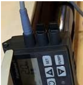
Plantomat® - für Langzeitbewässerung